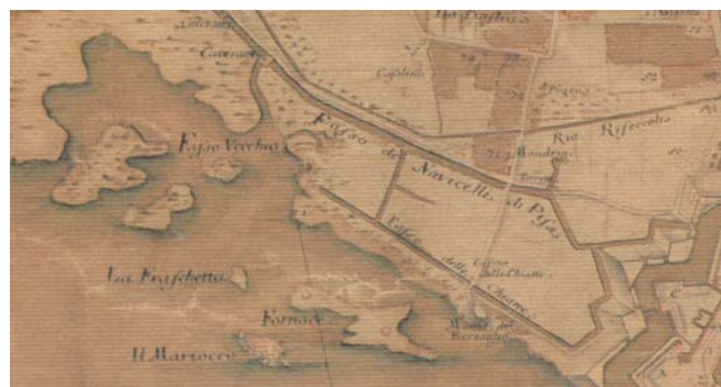
Fig.6 – Pianta della Città e Porto di Livorno , anonima e senza data, ma circa 1750; ora nella collezione della Fondazione Livorno.

Imprevedibilmente però, nella pianta " Parte del Piano di Livorno coll'indicazione de' vestigi dell'antico Porto Pisano ", di Ferdinando Morozzi , allegata allo stesso volume del Targioni Tozzetti, in cui la Fraschetta compare citata nel testo, il nome Fraschetta con disegno della torre è collocato in terra, in uno spazio compreso tra la linea di costa dei suoi tempi, indicata come "Lido Moderno", e il "Lido del mare dell'anno 1694" 15 .