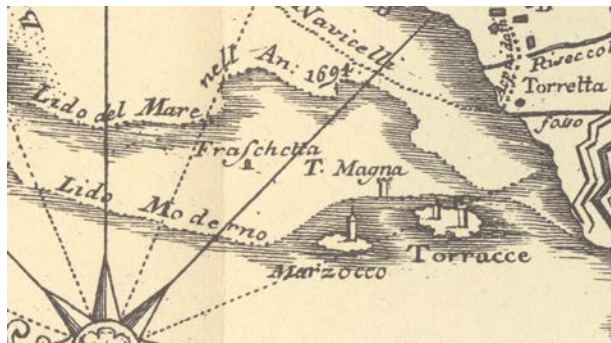
Fig.7 – Ferdinando Morozzi , Parte del Piano di Livorno coll'indicazione de' vestigi dell'antico Porto Pisano ; inserita in G.Targioni Tozzetti, Relazioni d'alcuni viaggi fatti in diverse parti della Toscana , vol.2, inserita tra pag.378 e pag.379, Firenze 1748.

A sua volta anche il Santelli allegò una pianta al suo lavoro, disegnata dall'ingegnere Carlo Maria Mazzoni , intitolata “Planimetria di Porto Pisano, di Livorno e de loro territori” . Questo disegno riproduce in quasi tutti i particolari quello di Ferdinando Morozzi; fra le poche differenze dobbiamo notare una diversa collocazione della “Torre Fraschetta”, ora chiaramente in mare, vicinissima al Marzocco, molto più vicina della “Torre Magnan” 17 .