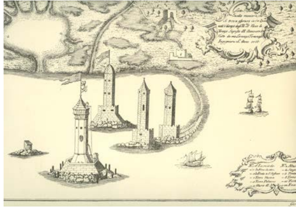
Fig.4 – Copia fatta dall'Ing. Tommasi (1766) di una veduta posta nella sala dei Signori Nove a Firenze, attribuita al 1530.

Ricordiamo poi la pianta di Andrea Dolcini , datata al 1749 e riportata nell' Atlante Warren 12 , e la coeva carta anonima di proprietà della Cassa di Risparmi di Livorno (ora Fondazione Livorno), diffusa qualche anno fa in una bella ristampa a colori 13 .