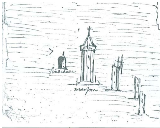
Fig.2 – I confini della pesca del Calambrone, in Archivio di Stato di Livorno, Comune preunitario n.134,c.862. Particolare.

pesca detta “ nello Stagno ”, in quegli anni di competenza del cardinale Carlo dei Medici. Nel dicembre 1631, per dirimere la questione, furono stabiliti i confini delle zone di diversa pertinenza: la pesca del Calambrone andava da un termine posto in terra a Nord della Bocca di Stagno, detto Ciocco di Stagno , alla bocca di Stagno e fino alla Fraschetta. Per l’occasione fu disegnato uno schizzo di mappa, allegato agli atti. Questa è la più antica fonte in cui ho trovato scritto il termine “ Fraschetta ”, che nel disegno corrisponde a un edificio, riportato in modo confuso e molto più basso rispetto alle altre torri del vecchio Porto Pisano che vi compaiono, interpretabile come il residuo di una torre 9 .