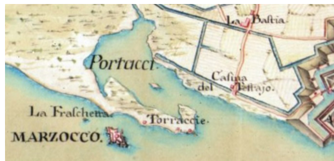
Fig.5 – Andrea Dolcini , Pianta di Livorno e sue adiacenze , 1749, in Edoardo Warren , Raccolta di piante delle principali città e fortezze del Gran Ducato di Toscana , pag.56-57, il cui originale è conservato in Archivio di Stato di Firenze.

Ricordiamo poi la pianta di Andrea Dolcini , datata al 1749 e riportata nell' Atlante Warren 12 , e la coeva carta anonima di proprietà della Cassa di Risparmi di Livorno (ora Fondazione Livorno), diffusa qualche anno fa in una bella ristampa a colori 13 .