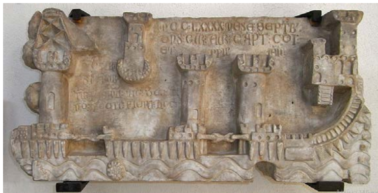
Fig.1 – Bassorilievo esistente in Genova, Museo di Sant’Agostino, datato 1290, che raffigura la situazione del Porto Pisano subito prima della distruzione del 1290. Trascrizione dell’iscrizione: « MCCLXXX MenSE SEPTemBris || DomiNuS CUnRadus AUrie CAPiTaneus COMunI || ET PoPuLI IANue || DeSTRU||SIT POR||TUM PISANUm NIColaus De GULIEL||NO FECIT FIERI HOC ».

Esiste un altro riferimento alla Frasca, questa volta senza torre, cioè come semplice scoglio: è una ripetizione, in forma abbreviata, della legge che abbiamo citato sopra per il 1287, ed era inserita nel Breve Curiae Maris Pisanae civitatis del 1304: