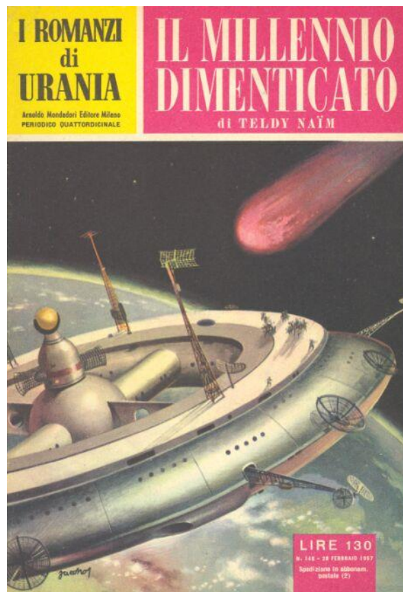
Fig.2 – Carlo Jacono: copertina del libro Il millennio dimenticato , di R.Teldy-Naïm.

Dunque, passando dal romanzo alla realtà, potrebbe darsi che nel Medioevo ci sia stato qualcosa di tanto pericoloso che, una volta svelato, provocherebbe danni agli uomini di oggi e del futuro. Sarebbe quindi opera meritoria non solo non dire e non cercare la verità in proposito, ma addirittura operare per nascondere e dissimularla così che anche coloro che, di animo malvagio o sconsiderato, vogliono lo stesso trovarla e renderla nota, ne siano ostacolati. Infatti è noto che esistono persone tipo Pandora, della mitologia greca, o Eva, della mitologia ebraica, che, coscientemente o meno, sono disposte a correre qualsiasi rischio pur di appagare la propria curiosità.